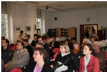
Photo : TIL UPMC en Action dans la salle de conférence de l'hôpital Charles Foix

➤ L'équipe de l'UPMC a convié, le 16 mai dernier, au sein de l'hôpital Charles Foix, dans la salle de conférence, les enseignants et professionnels participant au programme TIL afin de leur présenter l'enseignement d'excellence TIL. Ce temps de rencontre, intitulé TIL UPMC en action a rassemblé une cinquantaine de personnes qui ont découvert le projet et eu une présentation concrètes des enseignements proposés. Plus de 100 programmes ont été distribués aux invités et 70 affichettes ont été remises aux participants de la soirée afin de pouvoir être affichées dans leurs établissements pour informer les personnes de l'ouverture des inscriptions aux diplômes TIL UPMC.