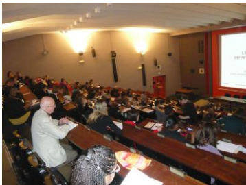
Photo : 23 ème Journée de l'Institut de Gérontologie Yves Mémin à l'amphithéâtre Charcot à l'Hôpital Salpêtrière

➤ Le 28 mai , la 23 ème Journée de l'Institut Universitaire de Gérontologie Yves Mémin à l'amphithéâtre Charcot à l'Hôpital Salpêtrière a rassemblé plus de 100 auditeurs. Lors de cette journée, l'équipe de l'UMPC a présenté le programme TIL et a distribué plus de 50 affichettes de présentation aux participants afin de communiquer sur le projet.