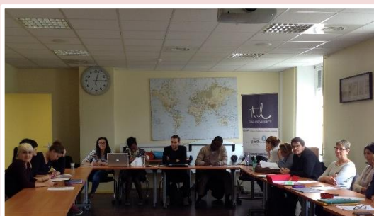
Promotion 2015-2016 Master 2 Expertise en Gérontologie de l'UPMC

La journée s'est poursuivie par la présentation de la plateforme par les équipes techniques des 2 sites et qui en ont profité pour sensibiliser les apprenants à cet outil numérique sur lequel les étudiants vont passer beaucoup de temps cette année. En effet, la plateforme héberge tous les cours du Master, un forum de discussion et de nombreuses informations complémentaires .