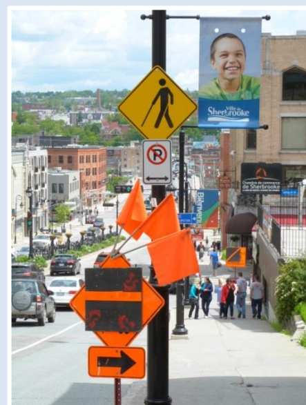
Signalisation devant les établissements pour personnes âgées dans la ville de Sherbrooke