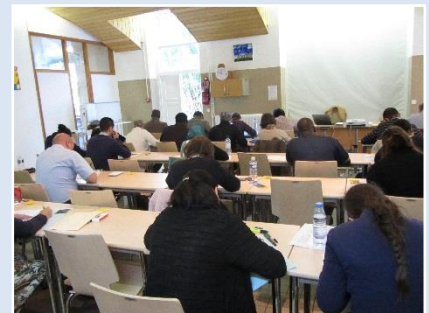
Le 10 septembre les étudiants ont composé de 9h30 à 13h et de 14h à 18h